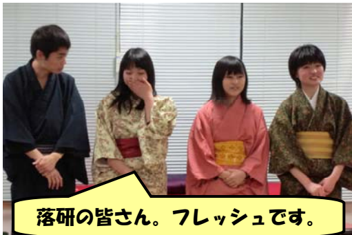
落研の皆さん。フレッシュです。

☆奇数月の第 2 土曜日に、井田デイサービスセンターダイルームにて「落語カフェ井田」を開催しております。こちらの方もあわせてお越し下さいませ。