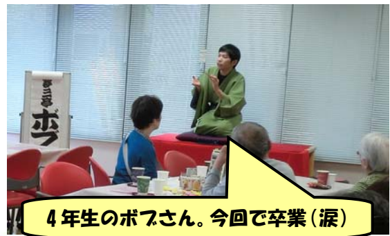
4年生のボフさん。今回で卒業(涙)