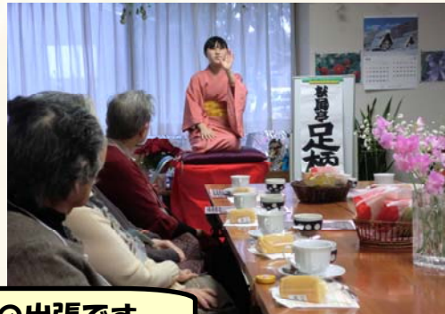
落語カフェ井田の出張です。